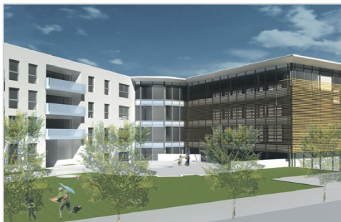
Projet architectural Atelier d'Architectes Grivel & Cie SA (AGG).

Ce projet pourrait à l'avenir être porteur d'un nouveau regard sur la place de la personne âgée et fragilisée par la maladie et le handicap au sein de la société. Ce ne serait plus une personne que l'on isole dans un bâtiment conçu, certes, pour elle, mais une per-